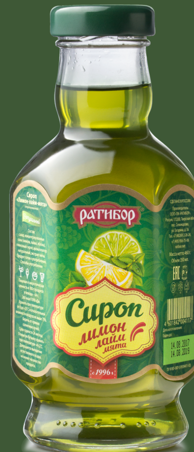
лимон лайм мята