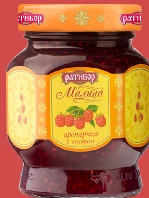
МАЛИНА протертая с сахаром