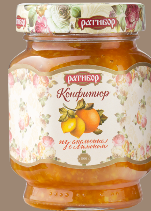
апельсин с ЛИМОНОМ