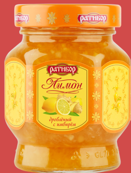
ЛИМОН дробленый с имбирем