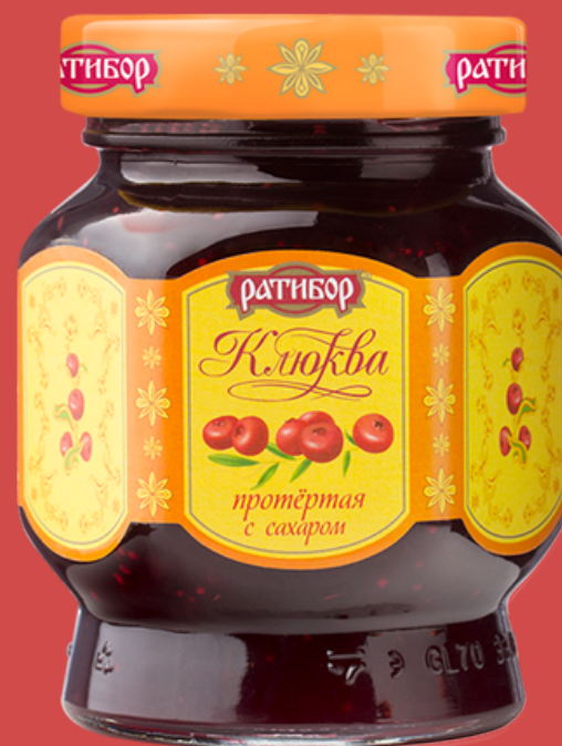
КЛЮКВА протертая с сахаром