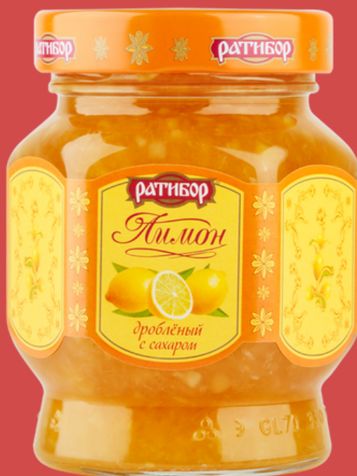
ЛИМОН дробленый с сахаром