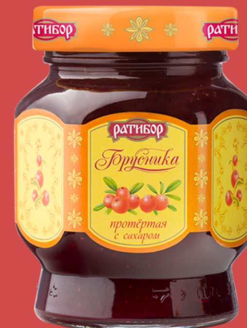
БРУСНИКА протертая с сахаром